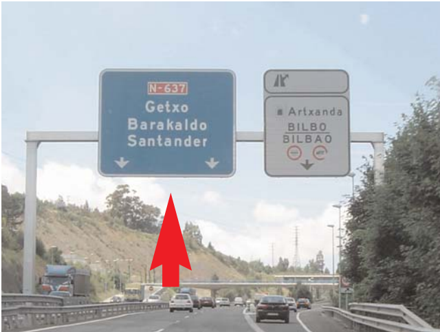
Seguimos la dirección Getxo - Barakaldo - Santander hasta... Keep on going destination Getxo - Barakaldo - Santander till...