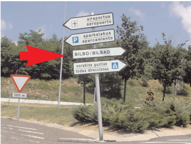
Salimos del aeropuerto en dirección a Bilbao... Exit the airport towards Bilbao...