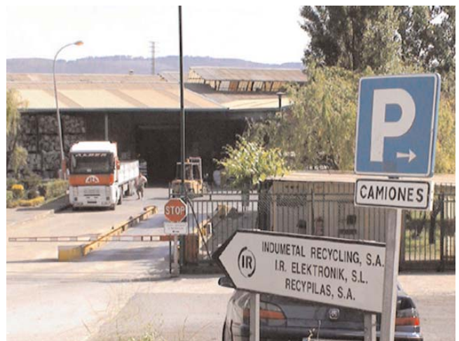
... giramos a la izquierda y ya estamos en Indumetal . ... turn to the left and you are at Indumetal .