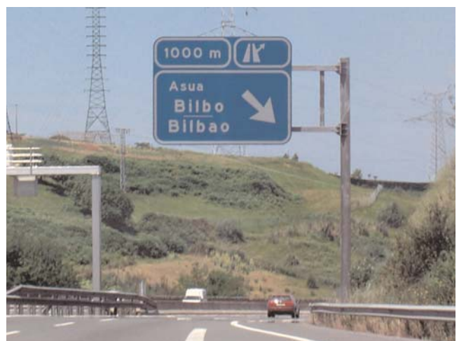
Continuamos y posteriormente tomamos la salida Asua Take the "Asua" exit