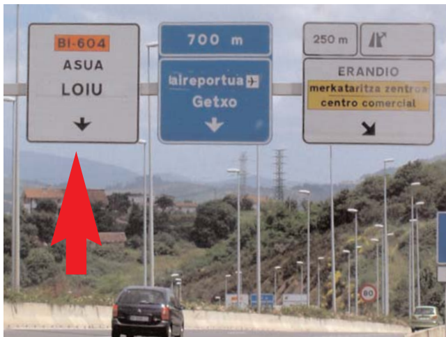
Tras dejar atrás dos gasolineras, tomamos dirección Asua After been passed two petrol stations take direction "Asua"