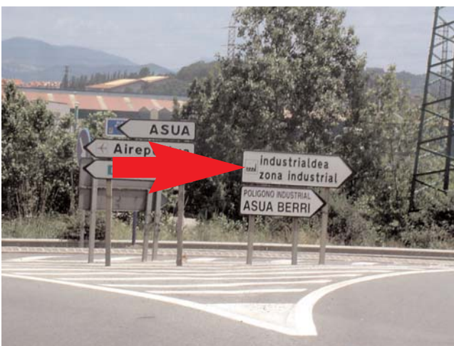
Seguimos dirección Industrialdea y a escasos metros... Follow direction "Industrialdea" and after a few meters...