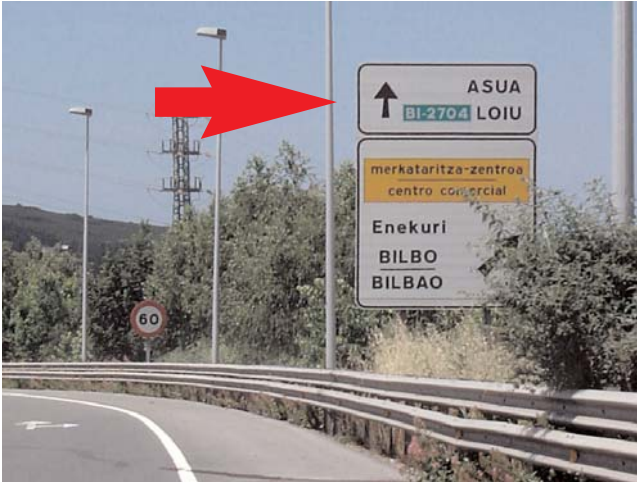
Tras salir, tomamos dirección Asua / Loiu After exiting take destination " Asua / Loiu "