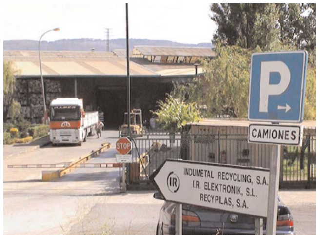
Seguimos dirección Industrialdea y a escasos metros... Follow direction "Industrialdea" and after a few meters...