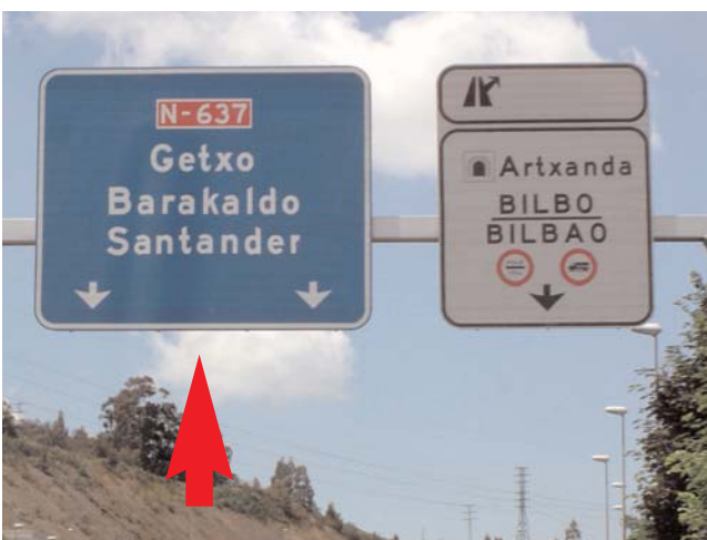
... hasta el desvío a Getxo - Barakaldo - Santander ... Keep on going to the "Getxo - Barakaldo - Santander" turning