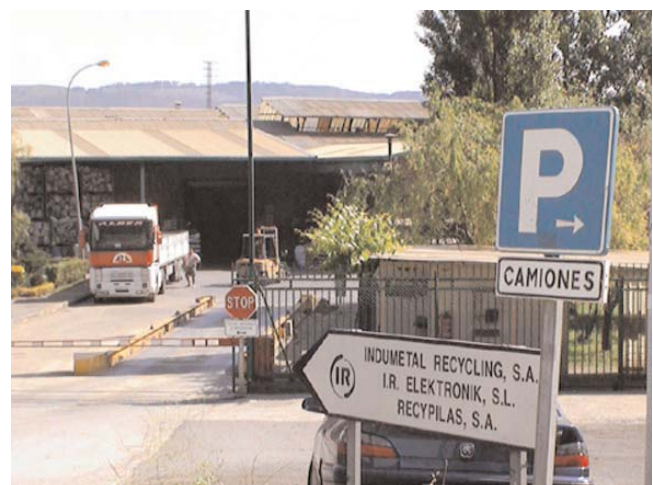
... giramos a la izquierda y ya estamos en Indumetal . ... turn to the left and you are at Indumetal .