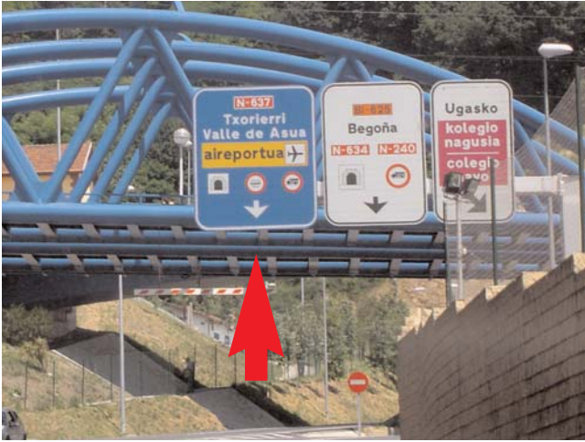
Desde el Museo de Bellas Artes, tomamos el Puente de Deusto hasta la rotonda. Tomamos la primera a la derecha y seguimos la indicación Txorierri - Valle de Asua - Aireportua From the Museum of Fine Arts, take the Deusto bridge to the traffic circle. Take the first right allowed and follow the directions to "Txorierri - Valle de Asua - Aireportua".