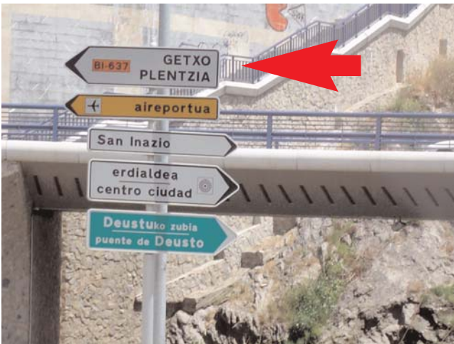
Al salir del túnel tomamos dirección Getxo - Plentzia After exiting the tunnel take direction "Getxo-Plentzia"