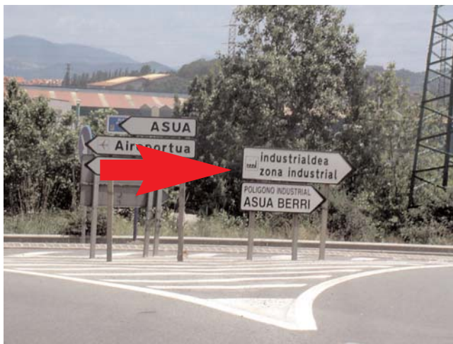
Seguimos dirección Industrialdea y a escasos metros... Follow direction " Industrialdea " and after a few meters...