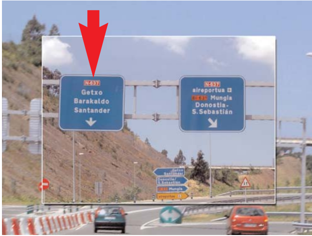
Tras salir del túnel, tomamos la dirección Getxo - Barakaldo - Santander After exiting the tunnel take destination Getxo - Barakaldo - Santander