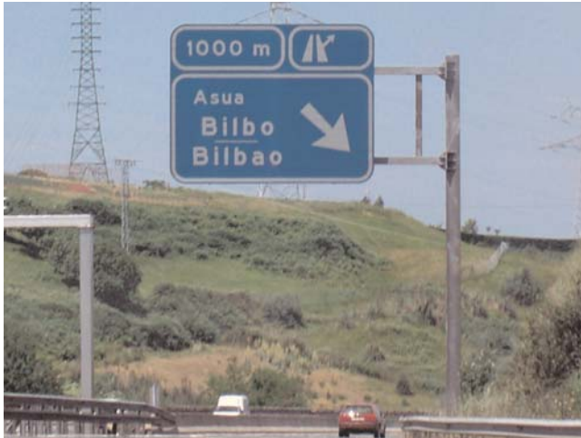
... la salida hacia Asua / Bilbao ... the Asua / Bilbao exit