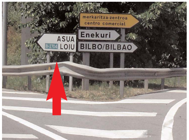
Tras salir, tomamos dirección Asua / Loiu After exiting take destination "Asua / Loiu"